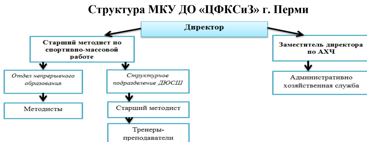
Рисунок 1. Структура муниципального казенного учреждения дополнительного образования «Центр по физической культуре, спорту и здоровьесбережению» г.Перми

В целом, система управления обеспечила становление, стабилизацию, оптимальное функционирование и должна быть нацелена на дальнейшее развитие учреждения. (Рис. 1).